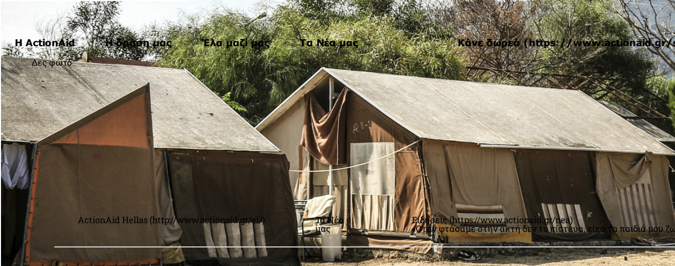
H ActionAid Δες φωτο