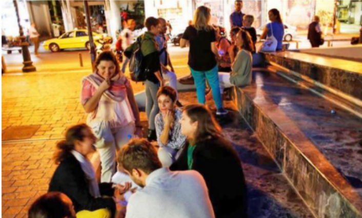
Η ιδέα του Refugees Welcome ξεκίνησε πριν από μερικούς μήνες από τη Γερμανία, όπου μια ομάδα εθελοντών αποφάσισε να δημιουργήσει ένα δίκτυο φιλοξενίας προσφύγων σε οικογένειες στη Γερμανία