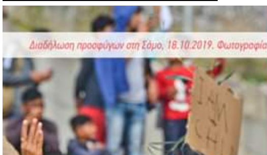
Διαδήλωση προσφύγων στη Σόμο, 18.10.2019.

ΖΩΝΤΑΝΗ ΜΕΤΑΔΟΣΗ ΤΡΙΤΗ 28 ΑΠΡΙΛΙΟΥ 8ΜΜ ΕΚΚΕΝΩΣΤΕ ΤΑ CAMP! ΟΙ ΠΡΟΣΦΥΓΕΣ ΣΕ ΞΕΝΟΔΟΧΕΙΑ & ΣΠΙΤΙΑ