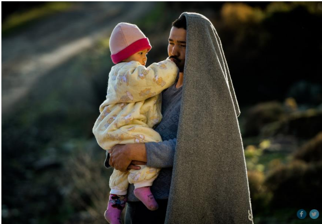
Οι πρόσφυγες στην Σκάλα της Συκαμιάς. Παρασκευή 6 Μαρτίου 2020.