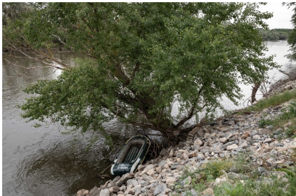
Konstantinos Tsakalidis / SOOC

Σύμφωνα με το άρθρο 33 της Σύμβασης της Γενεύης για το Καθεστώς των Προσφύγων, «καμία συμβαλλόμενη χώρα δεν θα απελαύνει ή θα επαναπροωθεί, κατά οποιονδήποτε τρόπο, πρόσφυγες στα σύνορα εδαφών όπου η ζωή ή η ελευθερία αυτών απειλούνται για λόγους φυλής, θρησκείας, εθνικότητας, κοινωνικής τάξεως ή πολιτικών πεποιθήσεων». Το άρθρο αυτό κατοχυρώνει την αρχή της μη επαναπροώθησης, η οποία συνιστά την πεμπτούσια της προστασίας των προσφύγων [1]. Δεδομένου ότι η αναγνώριση του προσφυγικού καθεστώτος έχει αναγνωριστικό και όχι συστατικό χαρακτήρα, η αρχή της μη επαναπροώθησης εφαρμόζεται εξίσου σε πρόσφυγες, που επιζητούν να εισέλθουν σε κάποια χώρα και σε αυτούς που έχουν ήδη εισέλθει. Το δικαίωμα μη επαναπροώθησης ενεργοποιείται από τη στιγμή που οι πρόσφυγες εγκαταλείπουν τη χώρα προέλευσής τους.