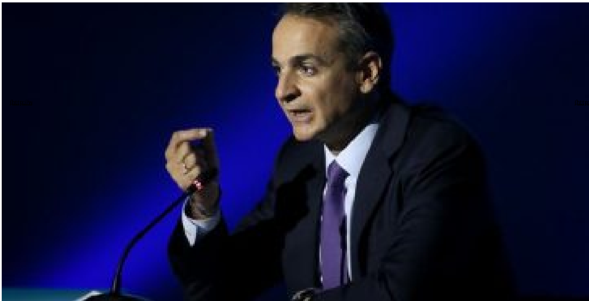
Φανερά ενοχλημένος με τους δημοσιογράφους στη ΔΕΘ ο Κυριάκος Μητσοτάκης, κανένας δεν ρώτησε για το φόρεμα της Μαρέβας (http://www.tokoulouri.com/politics/de8_psithikan/)