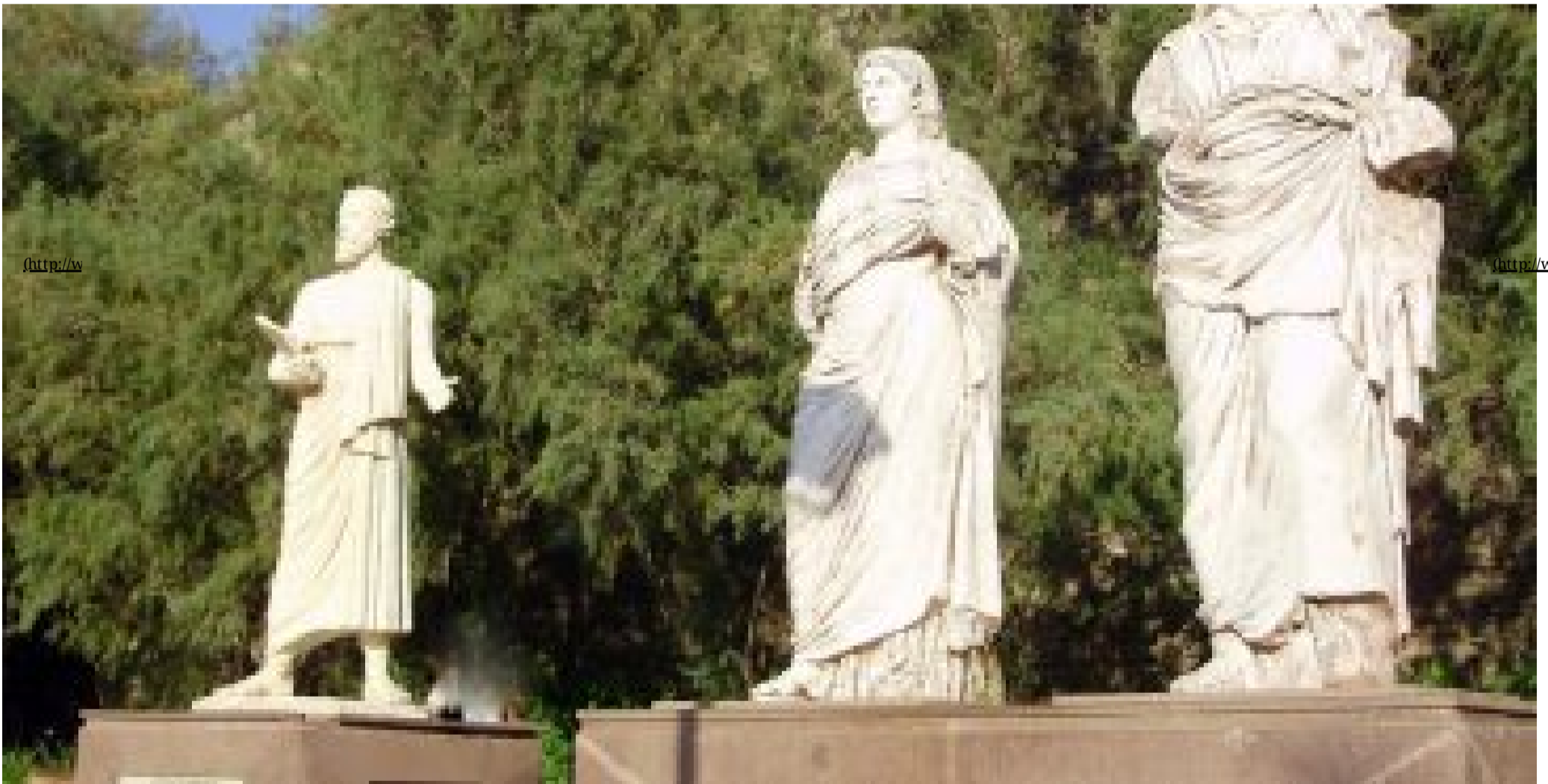
Κρεσέντο προκλητικότητας: Τούρκος πολίτης ανακηρύχθηκε ο Ηρόδοτος ( http://www.tokoulouri.com/international/alikamasefs/ )