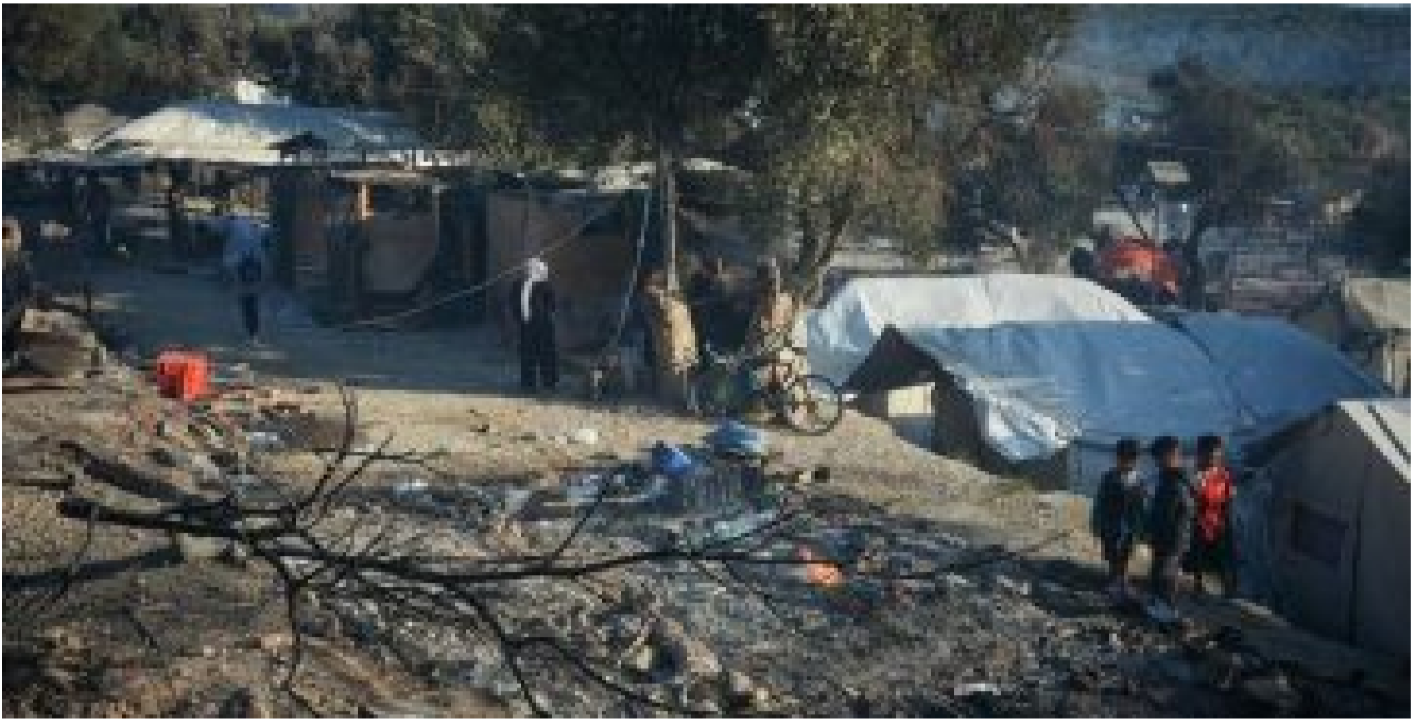
Μοναδική λύση για την Ελλάδα η άμεση απέλαση των ρατσιστών, πηγές επιβεβαιώνουν ( http://www.tokoulouri.com/society/morions/ )