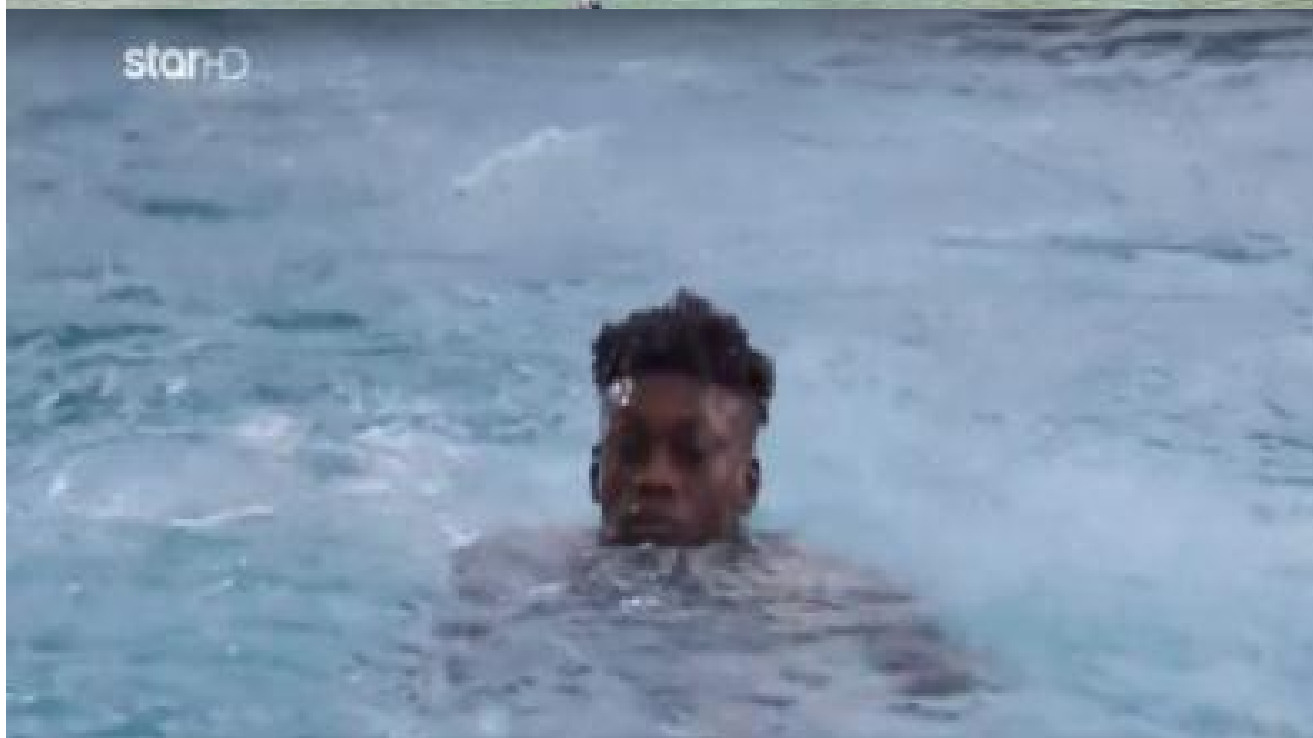
GNM: Δύο μοντέλα δεν ήξεραν κολύμπι, τρόμαξαν οι κριτές (vid)