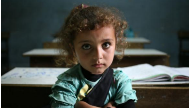
Το κοριτσάκι πάει σε ειδικό σχολείο για προσφυγόπουλα στον βόρειο Λίβανο. Το 40% των παιδιών στην πατρίδα της δεν έχει αυτό το προνόμιο. Η φωτογραφία είναι από τον Μάιο του 2014.