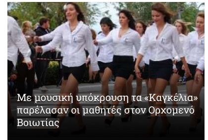
Με μουσική υπόκρουση τα «Καγκέλια» παρέλασαν οι μαθητές στον Ορχομενό Βοιωτίας

«Έχω δοκιμάσει τα πάντα, ακόμα και χρυσά λάπτοπ έστειλα σε συντάκτες γνωστής σατιρικής ιστοσελίδας να προωθήσουν τα σχέδια μου, αλλά οι λίγοι αφυπνισμένοι Έλληνες που διαβάζουν Μακελειό και Ελεύθερη Ώρα κάθε φορά καταφέρνουν να τα αποκαλύπτουν και να τα ματαιώνουν την τελευταία στιγμή. Αν δεν ήταν γι' αυτούς, θα τα είχα καταφέρει» τόνισε εμφανώς καταβεβλημένος ο μεγιστάνας.