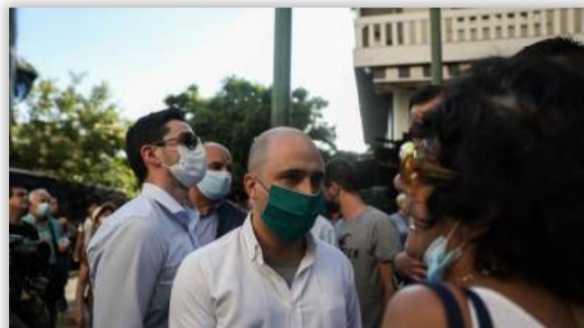
Μπογδάνος κατά μαθητών στις καταλήψεις: Τους παρουσίασε ως πιθήκους και «φίδια στον κόρφο των σχολείων»