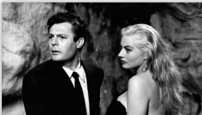
Ο Μαρτσέλλο Μαστρογιάννι μας ξεναγεί στη «Γλυκιά Ζωή» του Φεντερίκο Φελίνι